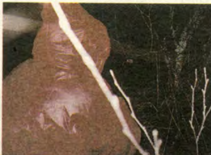
Viimeinen ilta (ylh.) ja viimeisen aamun shokki (alh.): keppi, viinapullo ja hapankaalia.

"Anteeksi, oota hetki... Olin vielä nukkumassa... Ei tietenkään jekuta!"