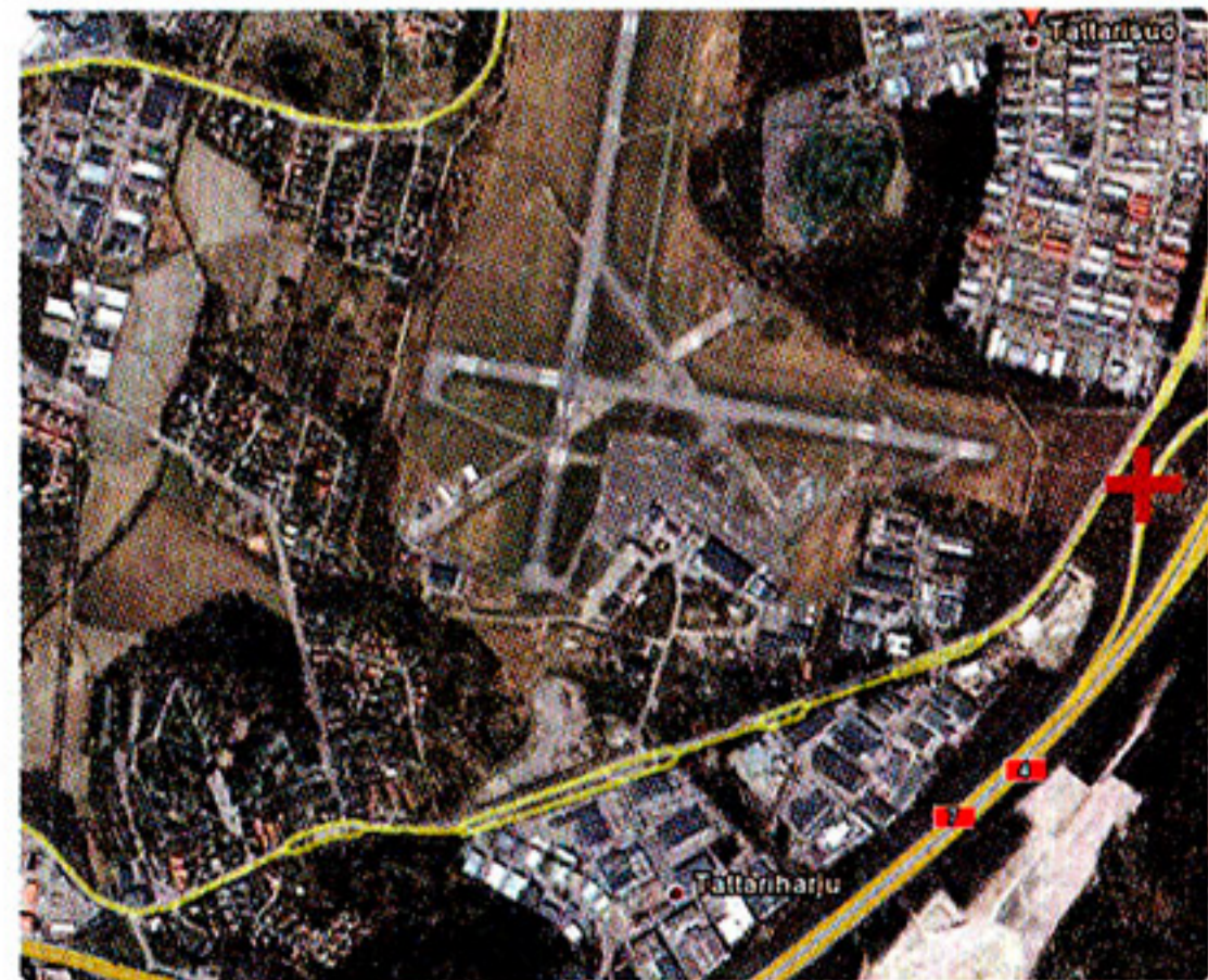
Lähde on nykyisin Tattariharjuntien ja Porvoonväylän rampin välissä, Malmin lentokentän kiitotien päässä.