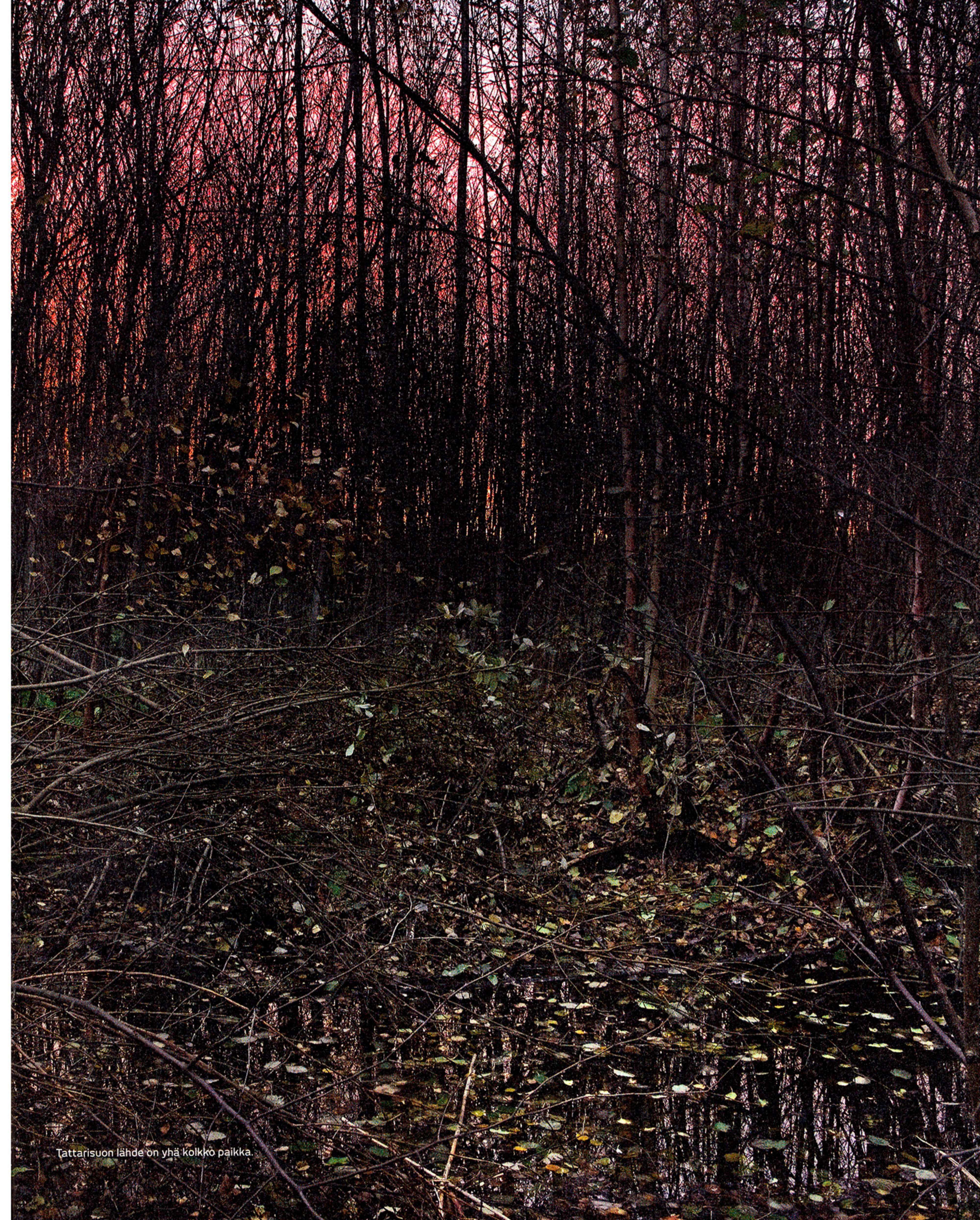
Tattarisuon lähde on yhä kolkko paikka.