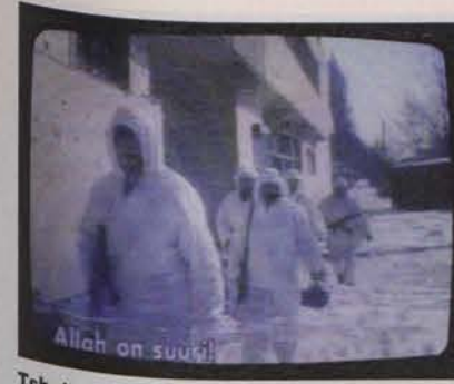
Tshetsheinit käyvät talvisotaa.

Pihat näyttävät rumilta ja surullisilta. Pensaissa on värivaloja. Kalpeat lapset pärskivät flunssassa, suuhun tulee peni-