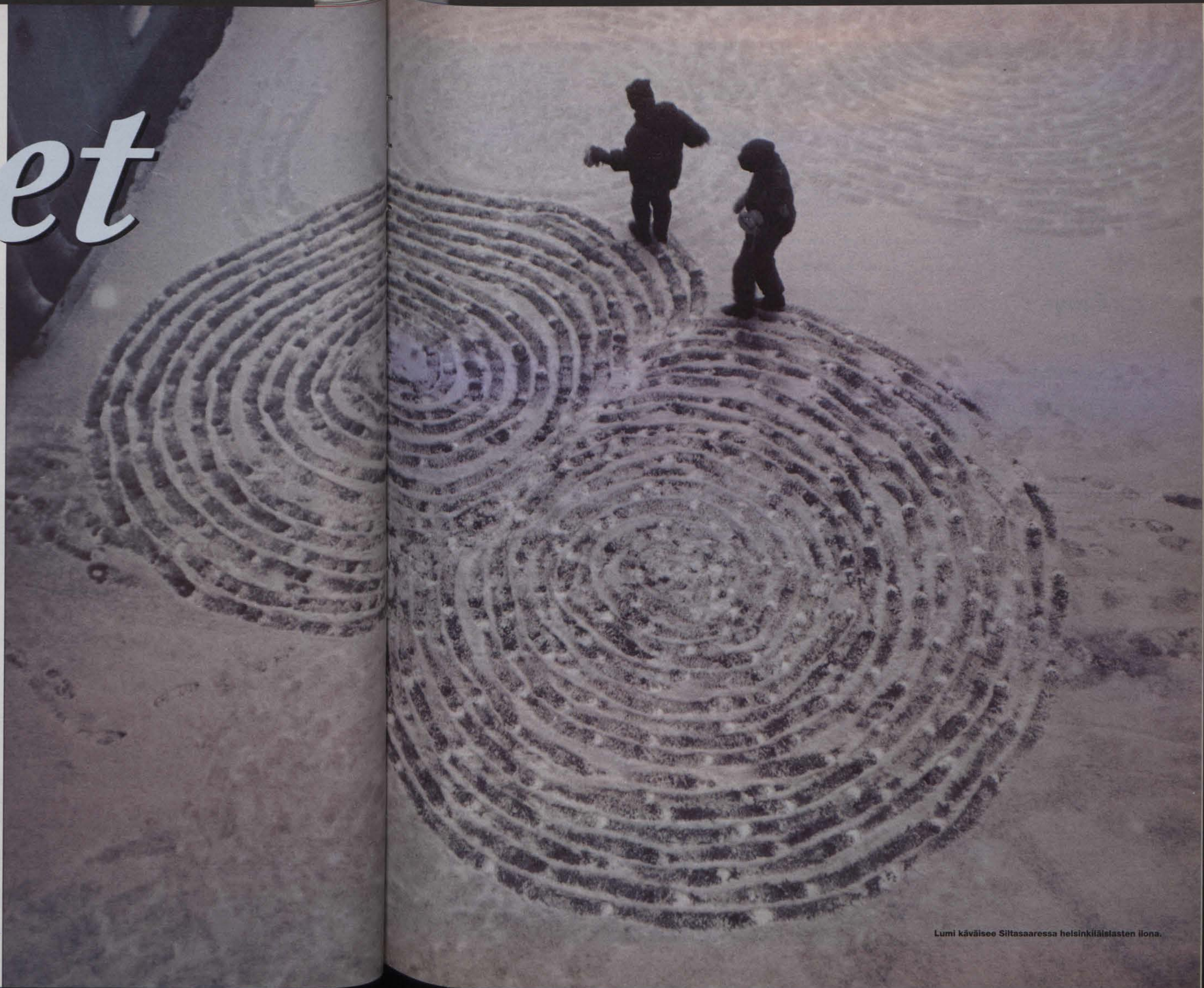
Lumi käväisee Siitasaarella helsinkiläisten ilona.

Mutta Helsingissä sataa ja sataa läpi lokakuun. Etelä-Suomi liikoo pariasteises-