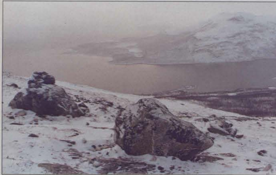
Kilpisjärven kolmen kuukauden lumeton aika on ohi.

Ja kun se on mennyt, se unohtuu kuin uni.