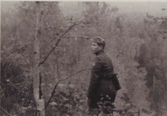
Pataljoonan parasta suunnistaja vuonna 1955 teki taukoamatta lintuhavaintoja, kesken kilpailun.

varmemman otteen. Hän tunki itsensä läpi räitsevän oksiston aina ohueen lantsaan asti. Kuivia oksia putoi kieppuen maahan. Tuulenpuskka huojutti lantaa. Ei saanut katsoa alas.