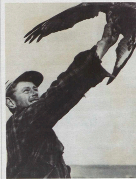
Karsi lintujen rengastaja ei käytä rukkasia (1968).

Signilskär on saari Ahvenanmaan ja Ruotsin välissä. Siellä on lintuasema, jossa aina yksi havain-