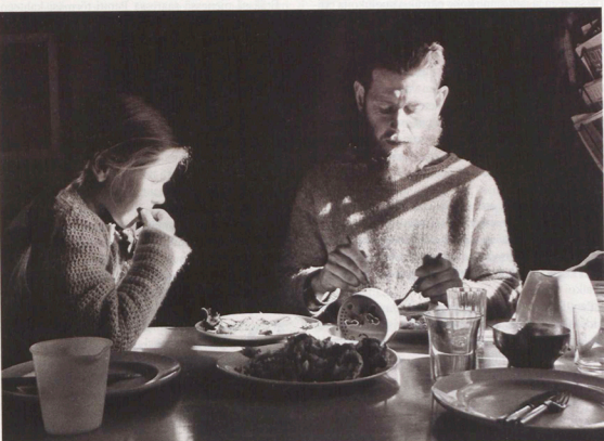
Mirjam-tyttären kanssa kala-ateriaalla kotona Kuhmoisissa 1969.

Itäisen ja öisin hän yritti kirjoittaa lupaamiaansa osia