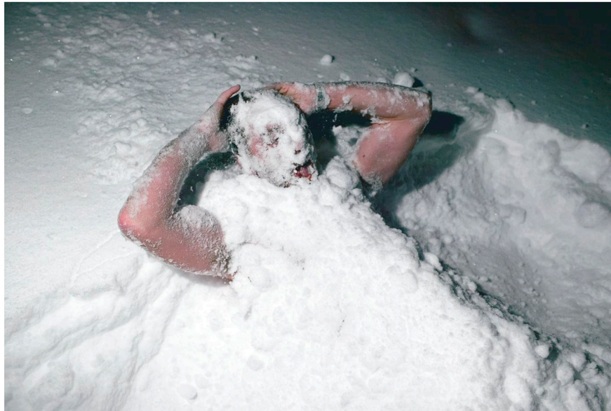
Löylyjen välillä Myllylä käy perusteellisesti lumipesulä.

Kehuaan kilpa puukiukaan löylyä. "Oreatampa töteröt", Myllylä sanoo ja poimii oluet jääkaappista. "Harmi kun ei oteutu makkaraa mukaan. Oli ollut mah-