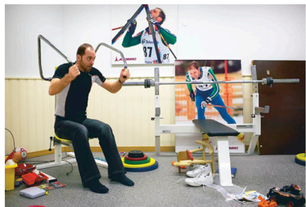
Alakerrassa on kuntosalu, jonka lapset ovat vallanneet leikkineissä.

Mutta nyt lumi on kuohkeaa, ja siten on reiteen asti. Umphangassa meno on hidasta