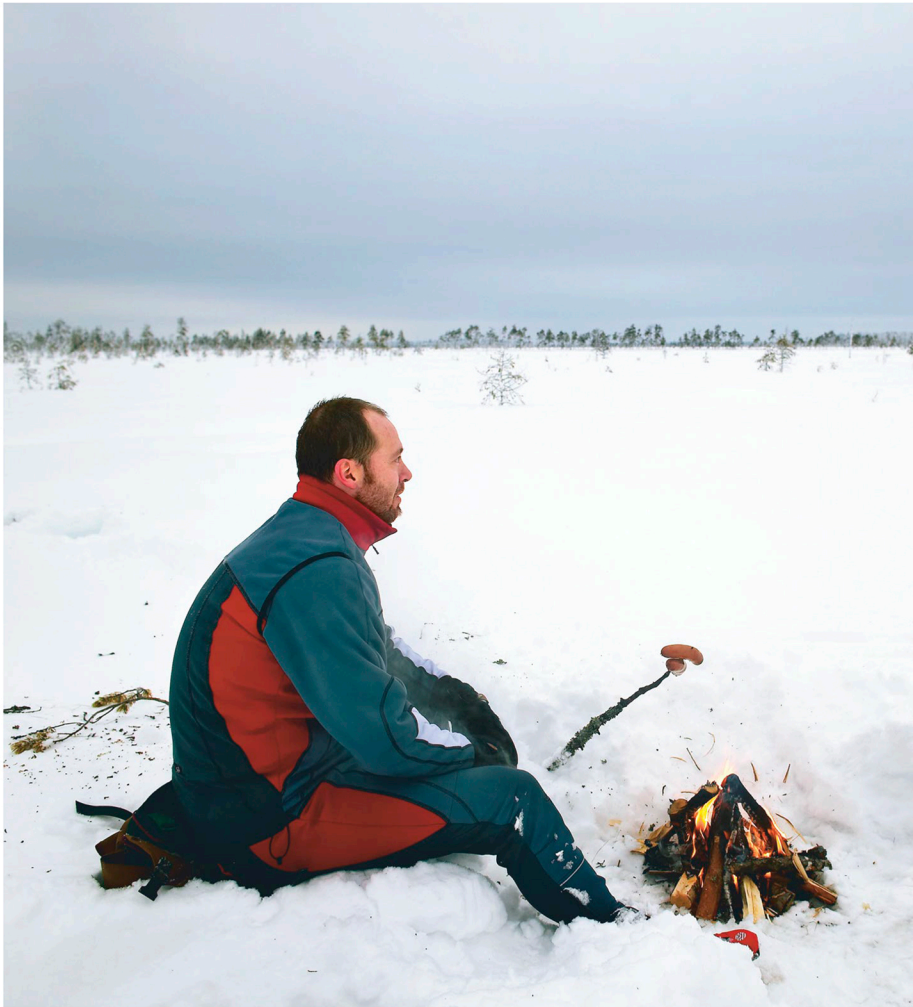
Tervanevalia on talvella aivan hiljaista.