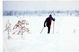
Hiihtäjä suuntaa kohti metsänreunaa eikä katsele taakseen.

ta. Jo sadan metrin jälkeen on pakko ottaa sukset käteensä ja jatkaa jalan.