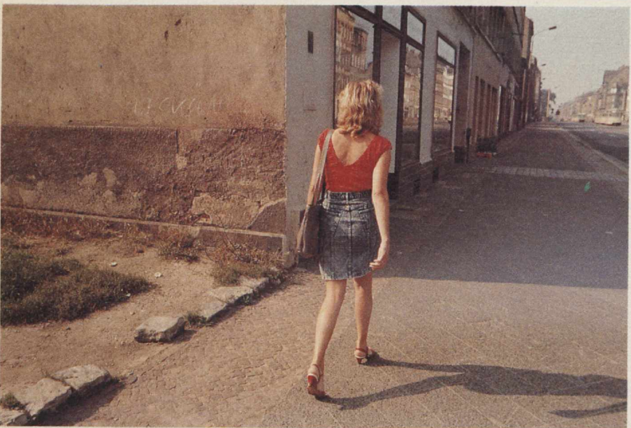
"Pitää jäädä, että jokin muuttuisi."

sisään, mutta ei täällä ollut mitään vietzävää."