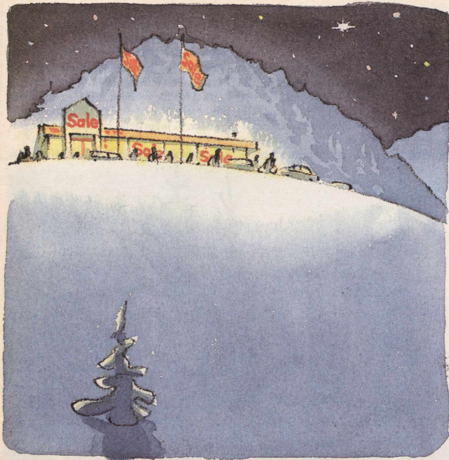
23 kilometriä rajalta: Avokadoja, kissanhiekkaa, camemberteja. Tuupovaara, 1993.

haaveiltiin vaivattomasta ravintopilleristä. Ennustus meni aivan metsään: nyt harrastamme ja valikoimme ruokia, puhumme ja luemme niistä, harkitsemme kattaaksia, valitsemme jopa loma-kohteen siellä saatavan ruuan mukaan. Robotteja emme keittiöön laskisi.