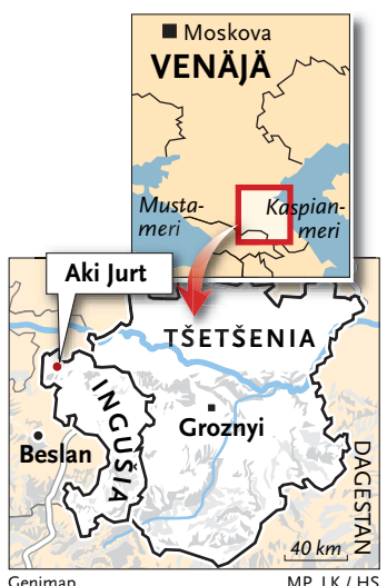
Genimap MP, LK / HS

määränsä vuoksi, joutomaille nousseiden telttakylien takia ja avustustyöntekijät eivät heitä muista. Satakunta jumiin jäänyttä evakkoa on mitätön osuus kaikista maailman paritakymmenestä miljoonasta pakolaisesta.