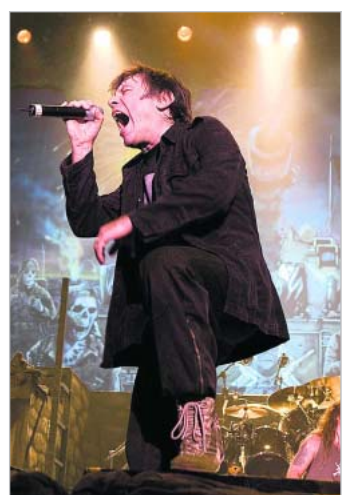
Iron Maiden esiintyy Olympiastadionilla (Paavo Nurmen tie 1) klo 19. Liput 63 ja 69 e.

KLUBIT Slam it. Livenä Tes La Rok. Slam it -dj:t. Kuudes linja (Kaikukatu 4, sisäpiha) klo 23–4. Liput 10 e. Cosmic Friday. Dj:t Poika ja Hirviö. Siltanen (Hämeentie 13 B) klo 21–2. Vapaa pääsy. Netsky (live). Dj:t Milla Lehto, Genki, Bates ja Defence-dj:t. DTM (Iso Roobertinkatu 28) klo 22–4. Liput 15 e. Fag You! Dj:t Shoplifter ja Janne X. Nolla (Pohjoinen Rautatiekatu 21) klo 22–4. Liput 5 e.