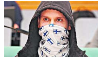
Mies tuomittiin myös poliitikon kaasuttamisesta.

Oikeus tuomitsi miehen kaikista niistä rikoksista, joista syyttäjä vaati hänelle rangaistusta. Tuomio tuli muun muassa törkeästä pahoinpitelystä sekä kokouksen estämisen ja poliittisten toimintava-