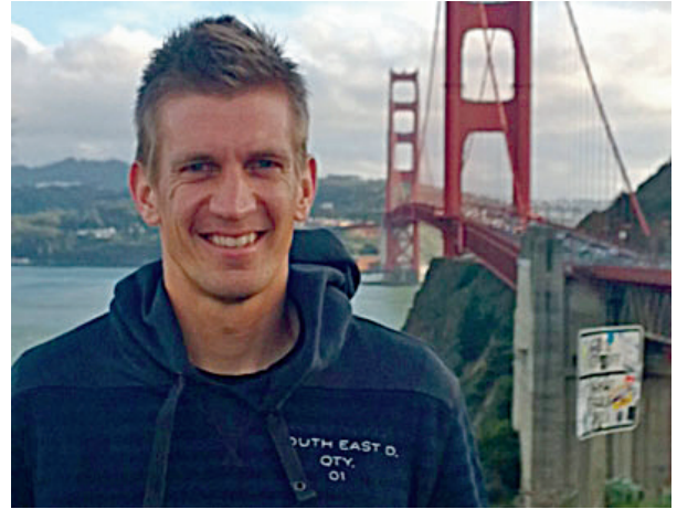
Tennispelaaja Jarkko Nieminen on homofobian vastaisen työn Hyvän tahdon lähettiläs 2014

Kirjoittaja on Sateenkaariyhteisöt ry:n kansainvälisenä homofobian ja transfobian vastaisena päivänä 17.5.2014 nimittämä homofobian vastaisen työn Hyvän tahdon lähettiläs tennispelaaja Jarkko Nieminen.