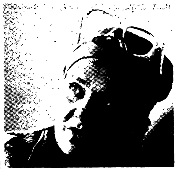
— Sivu 6. — Sivu 17.

Filmikomikan tähtien Marxin veljesten tyyppikehittelyä ja filmejä tarkastellaan sivulla 19. Ensi syksynä alkaa ilmestyvä satokunta osaa käsittävä marxismin julkaisuprojekti, jonka valmistamiseen on arvioitu kuluvan 20 vuotta. Karl Marxin jälleensyntymisen moniselitteistä ilmiötä selostetaan sivulla 20.