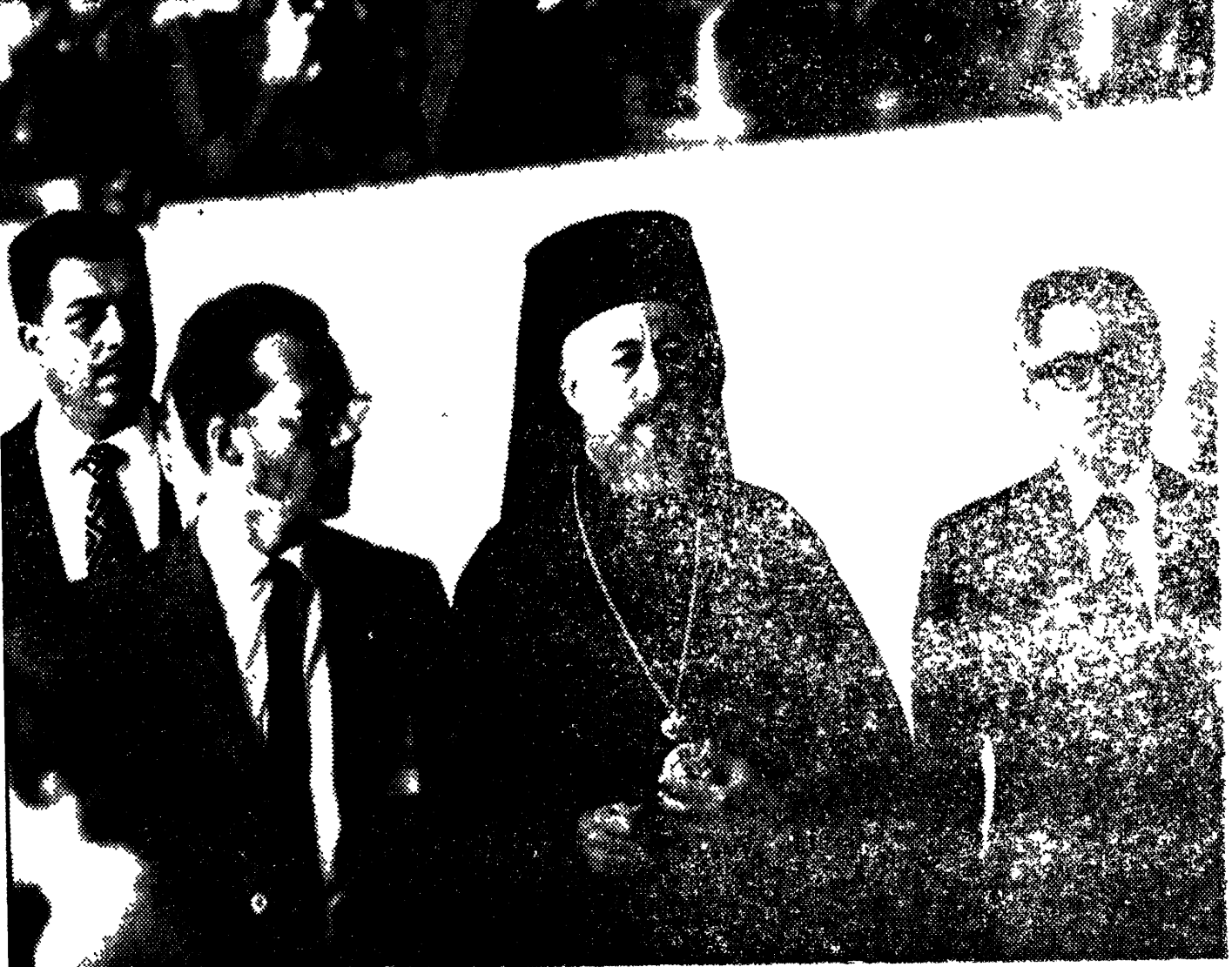
Kyproksen presidentin arkkipiispa Makarios syytti torstaina Turkia turvakokouksen päätösasiakirjan kymmenen kansojen välisä suhteita saatelevan periaatteen rikkinä.

Ilta puhejohtajan paikalle istuu Englannin pääministeri Harold Wilson ja puhujina ovat Liechtensteinin pääministeri Walter Kieber, Saksan ulkoministeri Gian Luigi Bertl, Luxemburgin pääministeri Gaston Thorn ja viimeisenä Vatikaanin edustaja arkkipiispa Agostino Casaroli.