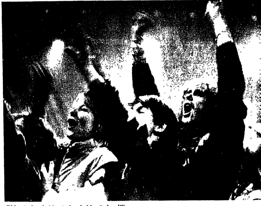
"Mo-tör-head, Mo-tör-head, Mo-tör-head!"

"Nuorempana tuli kokeiltua kaikenlaisia hanttihommia, välillä minulla oli oma hevosfarmikin. Olen muuten yhä vieläkin hyvä hevosmies.